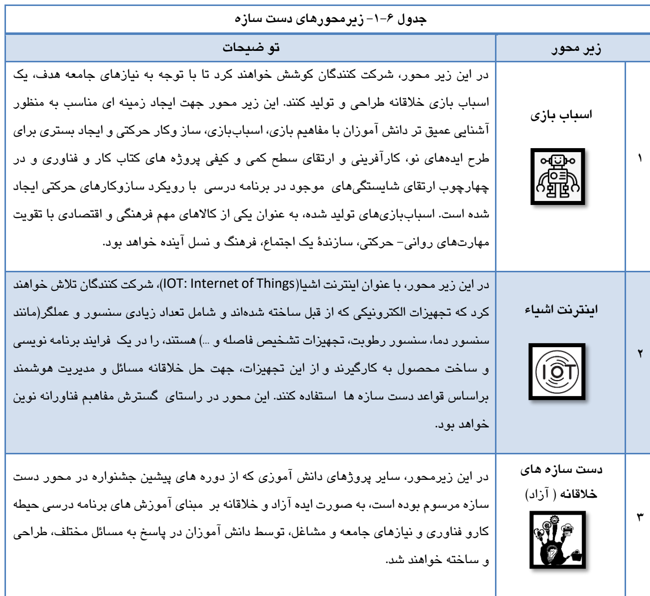
جدول ۶-۱- زیرمحورهای دست سازه